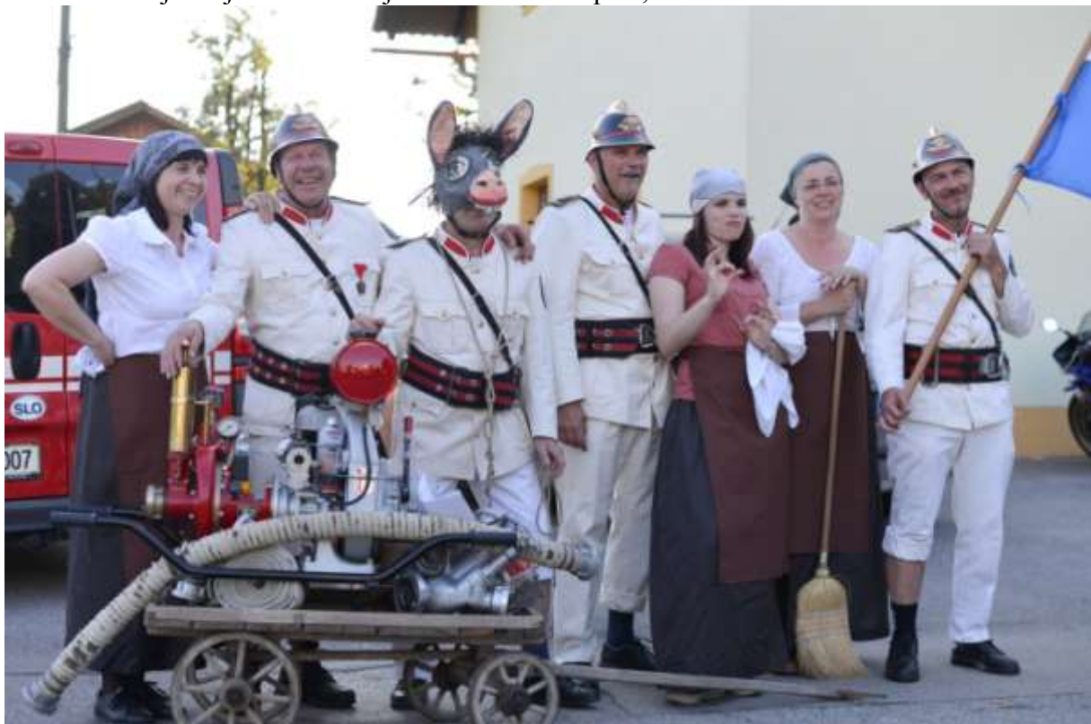
Smeh je pol zdravja