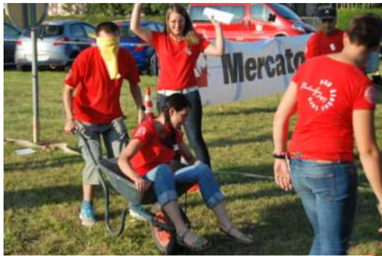
Jasna navodila - dober rezultat!