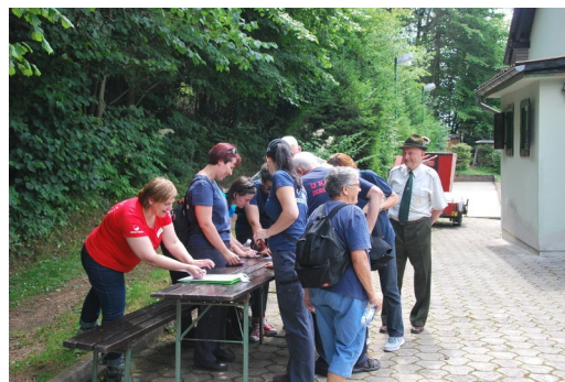
Kar vzemite si čas, se nič ne mudi.

sem se srečala na "krožni poti", so bili sproščeni, zadovoljni,....Tudi sama sem od vas odhajala dobre volje, zadovoljna in navdušena nad ponudbo različnih dejavnosti, ki so bile ponujene udeleženkam in udeležencem. Vse čestitke organizaciji in vsem prostovoljcem s katerimi sodelujete.