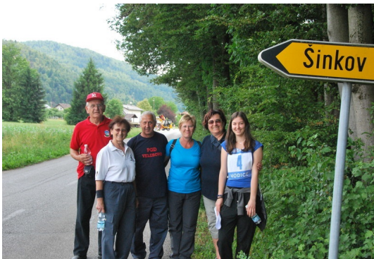
Mi smo pa ekipa...

kombinacija se je izkazala za izvrstno, saj so se stkala nova prijateljstva in okrepila trdna zavezništva. Izmenjala so se mnenja, prevetrili in razbili stereotipi. Udeleženci so si med potjo tako zaupali izkušnje iz svojih društev in mimogrede rešili tudi kakšno težavo.