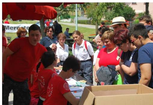
Takole smo se prijaviili...

Kot prostovoljka sem se na info točki počutila odlično. Ekipa je bila usklajena in nasmejana, tudi udeleženci so prihajali v časovnih razmakih, tako da je bilo delo lažje. Na udeležbo žal nismo imeli vpliva, bilo bi še bolje, če bi jih bilo več. Pohvale si zaslužijo vsi udeleženci, ki so sprejeli naš izziv in se odpravili na pohod tudi v mešanih ekipah. Menim, da so prav naključno narejene skupine med seboj povezale udeležence in bi to morala biti praksa za naprej. Pa seveda hvala za njihovo potrpljenje, saj je marsikdo moral večkrat ponoviti svoje ime in priimek.