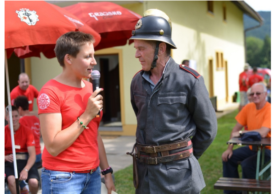
Tovariš, koliko pa je stara ta uniforma?

Udeleženci so se počasi odpravili domov, nekateri so z nami ostali še pozno v noč na veselici. Turnci pa smo se dobili že v nedeljo z dobrimi vtisi, zanimivimi pripetljaji in smešnimi dogodivščinami, ki bodo z nami ostali še dolgo, mnoge bodo prerasle v anekdote. V glavnem: imeli smo se lušno!