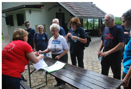
Izvolite, tu so vprašanja.

tudi zadovoljni odšli. Članice in člani, s katerimi