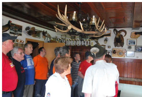
Zanimivo, kaj vse so ujeli...

V lovski družini Vodice je trenutno 33 članov, povprečna starost je 53 let. V svojih vrstah imamo štiri lovke, kar je tudi zavidanja vredno.