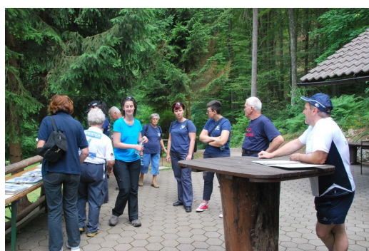
No, sedaj ste pa pri smučarjih ...