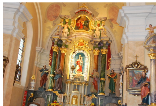
Notranjost - lepo obnovljena!

Pod zvonikom je glavni vhod v cerkev, do uvedbe električnega zvonjenja so tam visele vrvi za vse tri zvonove.