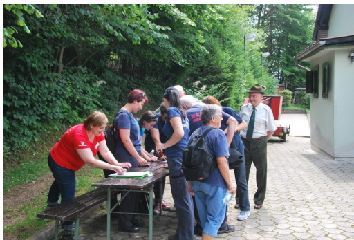
Dogajanje pri lovski koči.