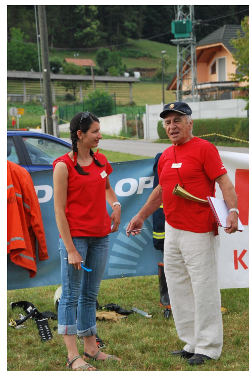
Mlada in malo manj mlad... je medgeneracijsko.