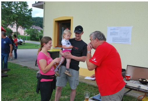
Veste, tako je treba delat.