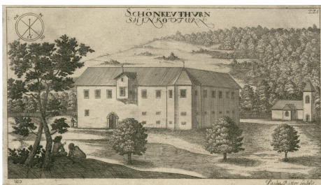
Grad, po Valvasorju