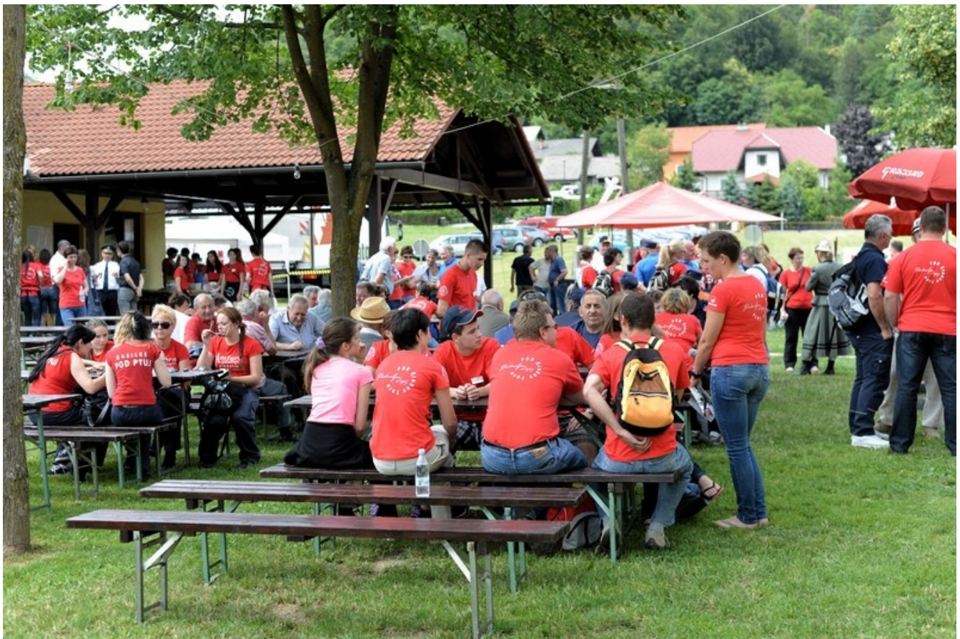
Mi mam se fajn, če prav vam je, al ne!