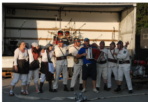
Eni so igrali...

Z veseljem sem vse te vedre obraze s hrano in pijačo postregla, skupaj smo tudi poklepetali in se nasmejali.