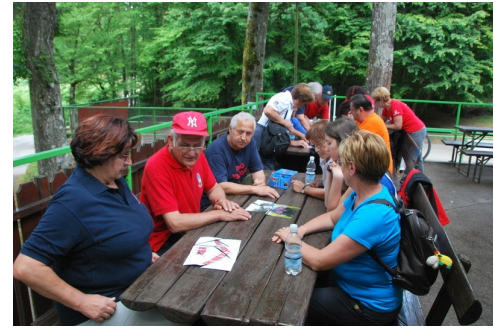
Slika je sestavljena.

Pri najini nalogi je bilo sproščeno, zabavno vzdušje. Počutila sem se zelo dobro. Menim, da je v današnjem času težko, a nujno potrebno povezovanje generacij, sodelovanje, medsebojno spoštovanje, odgovornost- skratka uveljavljanje vrednot. Vse to vam/ nam / je v tem programu ODLIČNO USPELO.