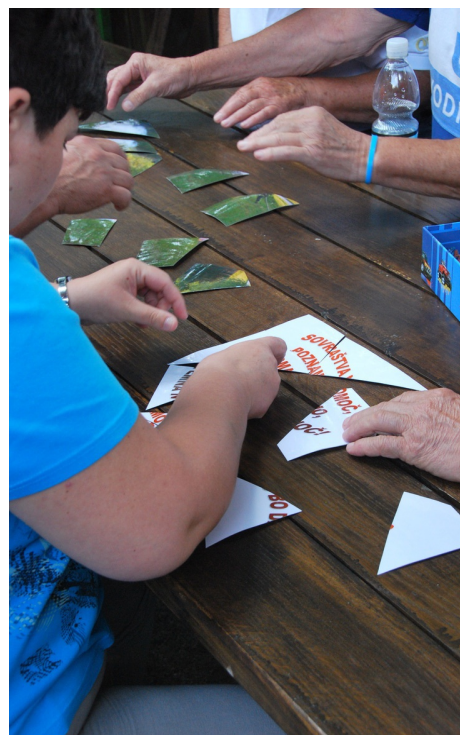
Pravilno sestavljeni delčki - celota.