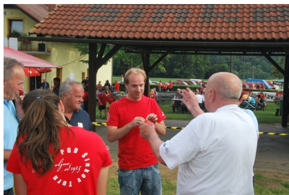
Veste, to je bilo pa tako...

Ob zaključku klepetalnice, v soboto zvečer, sem rekla naglas: med udeleženci se počutim kot riba v vodi. Gasilci smo res ljudje širokega duha, velikega srca, radostne narave in se radi družimo. Ni bilo težko najti sogovornika. Udeleženci so bili zelo odprti, pripravljeni na šalo, dobra volja je bila že v zraku. Ko sem odhajala, sem bila bogatejša za milijon evrov, pardon, za milijon točk pozitivne energije, toliko so mi dali... Privilegij mi je bilo spoznati vse te ljudi. Vedela sem, da sem tam zaradi njih in ne oni zaradi mene.