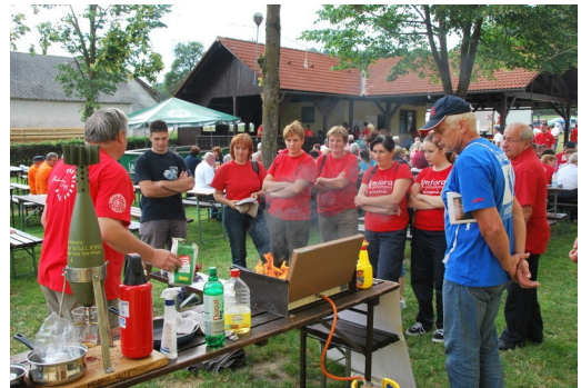
Tle se pa nekaj žge ..

Nekaj fotografij s komentarji sem dal na socialno omrežje facebook, kjer imam preko 700 prijateljev, ki bodo to videli in brali ter delili naprej. Ta dan sem ugotovil še nekaj. Starejši gasilci in gasilke so sicer zelo trmasti in prav potruditi se je potrebno, da jim neko stvar dokažeš in da začnejo razmišljat drugače in postati dojemljivi za novitete.