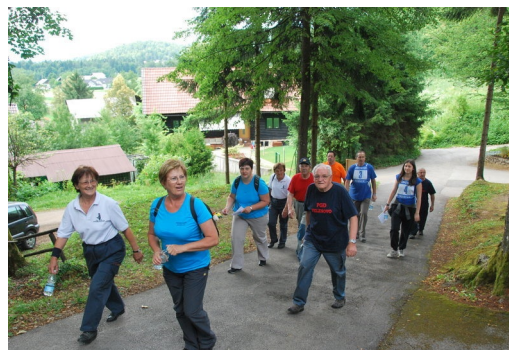
Kar urno stopimo, saj smo še mladi..

Tisti bolj radovedni so se odpravili na 3,6 km dolg pohod. Ekipe so bile sestavljene iz šestih članov, izbor je bil naključen. V eni ekipi je bila tako zastopana vsa Slovenija od juga proti severu, od vzhoda proti zahodu. Prekmurci so ugibali gesla pri pantomimi skupaj s Primorci, Belokranjci so tuhtali pravilne odgovore na kviz vprašanja z Gorenjci. Ta