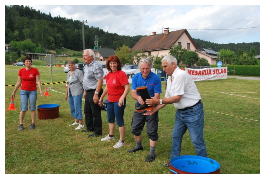
V slogi je moč, v škornju pa voda!

Če ne bi bilo veteranov, ne bi bilo gasilcev. Vsak kamenček v mozaiku šteje, doda nekaj zraven. Vodstveni kader, ki ne