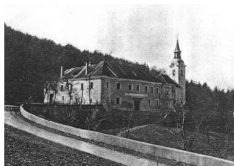
Fotografija gradu v času pred drugo vojno.