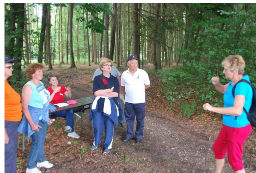
Tri besede ....

Priložnost za izboljšanje programa? Jaz je ne vidim, ker se mi zdi, da je vse potekalo usklajeno, kot bi moralo.