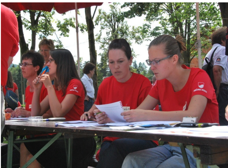
Navodila je potrebno upoštevati.

Udeleženci so me prijetno presenetili, vsi so bili prijazni, navdušeni nad dogajanjem in zelo sproščeni.