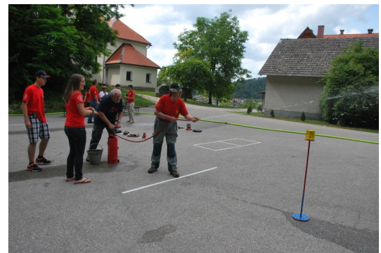
Mal bol dol, še mal dol...

Zame je bilo nepozabno in prekrasno: s kolegi in udeleženci, ki sem jih imel priložnost spoznati, vsi so bili super. Moram pa pohvaliti tudi domačine. Bil sem na delovni točki