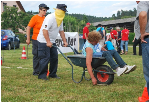
Levo, levo, pa ne tolk...

Poudarila je, da je še posebej ponosna na dekleta, mlade gasilke, svoje naslednice. Imajo veliko volje, so ambiciozne ter se neprestano izobražujejo. V gasilskih društvih GZ Lenart tako najdemo bolničarke kot nosilke IDA. Mladi v društvu jo spoštujejo in cenijo njen prispevek, saj je bila vrsto let tajnica in blagajničarka.