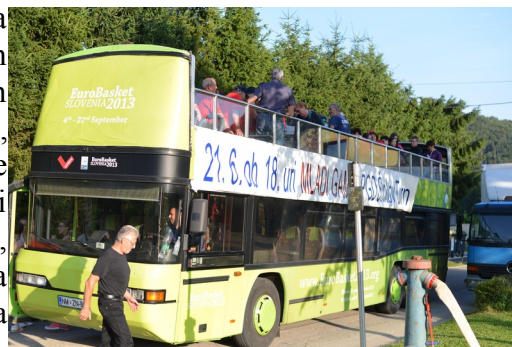
Ta ni imel voznega reda!