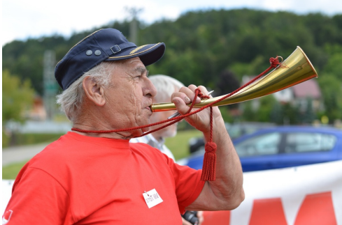
Tra - ra, tra - ra, ....

Ob mikrofону sem se počutila prijetno in sproščeno. Kamorkoli sem se lahko usedla za mizo in poklepetala. Z vsemi kot s starimi znanci gasilci. Želela bi si le še več ljudi. Takih za smeh, takih za razvajanje, takih za dogodivščine in takih malo zabubljenih. Kajti le skupaj in tako pisani, smo lahko v sreču bogatejši.