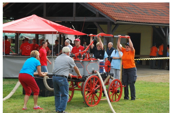
... pa še danes dobro nese, če dobro potisneš!