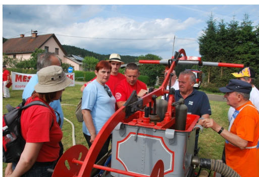
S tako so pa včasih šprical...